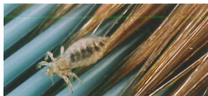
Hoofdluis op een kam.